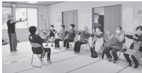
手指と頭の体操で介護予防