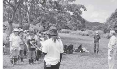
上埴遺跡で発掘体験