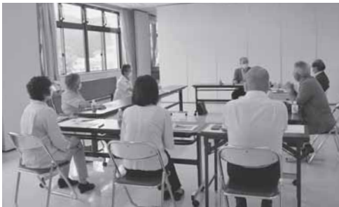
狙半内共助組織についての勉強会