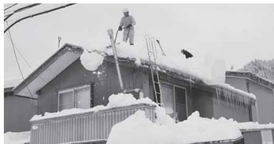
毎年ご難儀をおかけしている雪下ろし作業