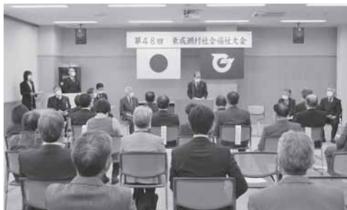
2年ぶりの開催となった社会福祉大会