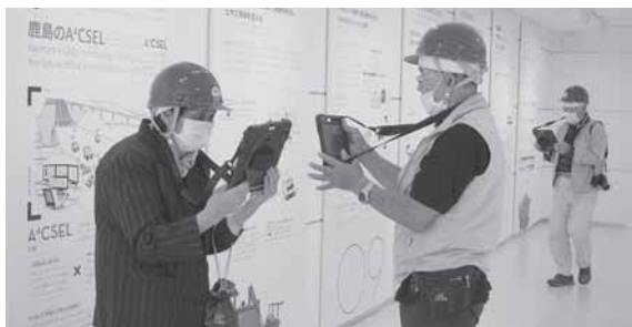
鹿島 DXラボを見学するシルバーバンク会員